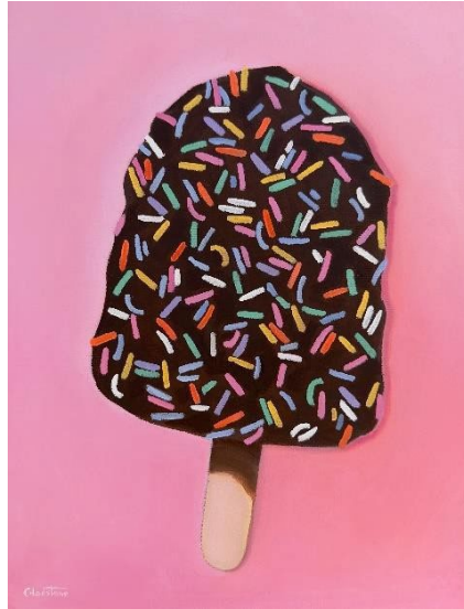
I'll Have Sprinkles , Joan Gladstone, impresión giclée, 2023

Estudió en la Escuela de Bellas Artes de la Universidad de Boston y en Laguna College of Art + Design, y ha pintado pinturas al óleo que celebran la vida en la playa durante más de 20 años.