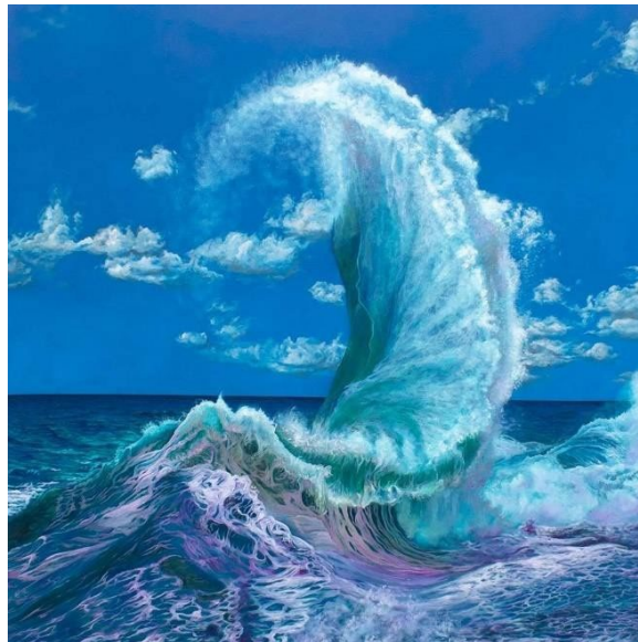
Hand of God , Jeffries Moore, óleo sobre lienzo, 2021

Las pinturas energéticas e hiperrealistas de Jeffries Moore buscan capturar el mar en su forma más poderosa y destacar tanto la belleza como el peligro del agua. Las pinturas a gran escala Hand of God son, seguramente, un punto focal de la exposición.